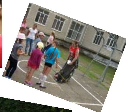
Праздник удался на славу!